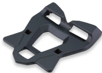
後箱底架 B7N-284X0-00 建議售價：NT$3,500