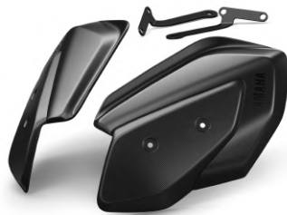
把手風罩 BKA-285F0-00-00 建議售價：NT$3,500