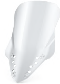
高風鏡 BKA-283J0-10-00 建議售價：NT$5,500