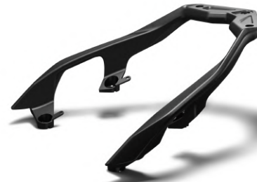
後架總成 BKA-248D0-00-00 建議售價：NT$3,500