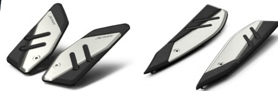
前置腳踏板 BMK-F74M0-00-00 建議售價：NT$3,500 後置腳踏板 BMK-F74M0-10-00 建議售價：NT$5,000