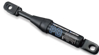
車身減震拉桿 B74-211H0-10 建議售價：NT$8,000