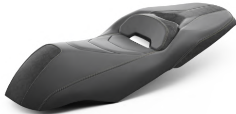
舒適坐墊 BMK-F4730-B0-00 建議售價：NT$10,000