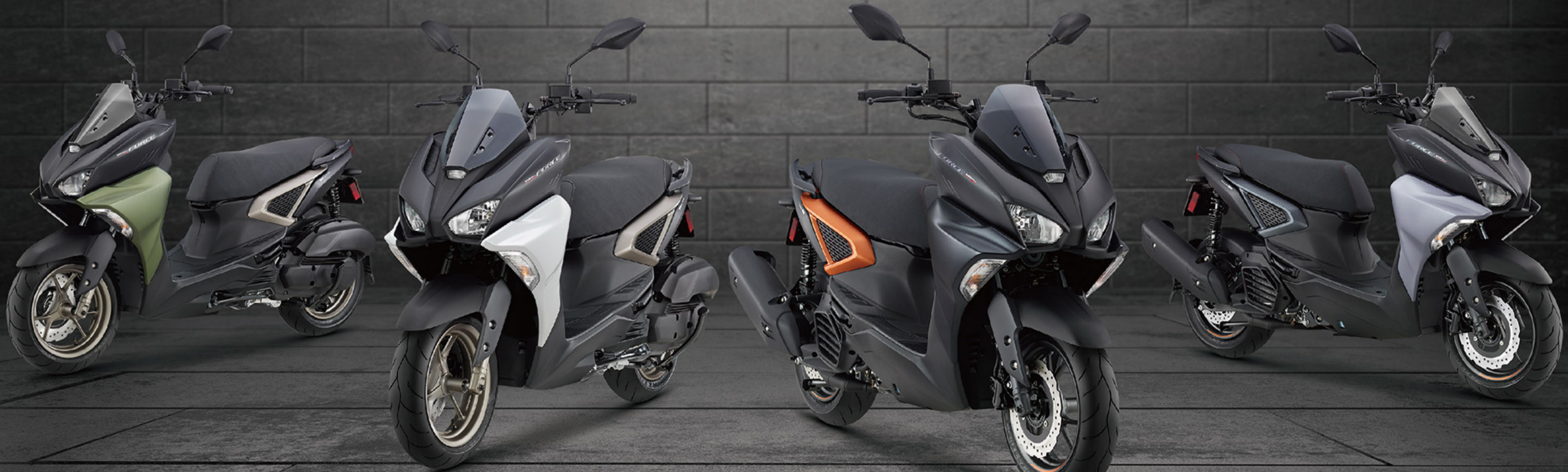
沙暴綠 E10AR1 綠深灰(消光)