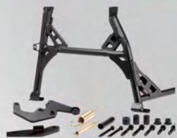
中柱 | BW3-F71A0-00