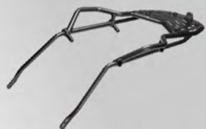
後架總成 | BW3-F48D0-00