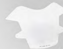
頭燈護罩 | BW3-H4105-00