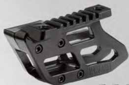
導鏈器 | BW3-F21G0-00