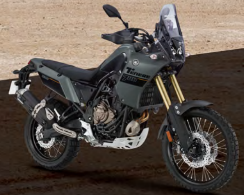
Tech Kamo 深灰 176451