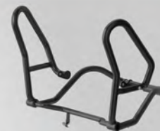
引擎保桿 | BW3-F43B0-02