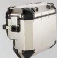
鋁側箱(右)37L | BW3-F846D-00