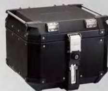
黑色鋁後箱42L | 23P-FTCAL-BL