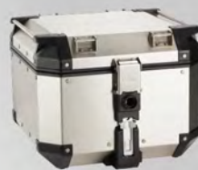
鋁後箱42L | 23P-FTCAL-NA