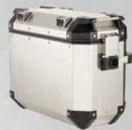
鋁側箱(左)35L | BW3-F846C-00