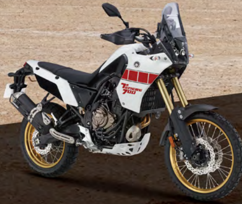
Classic White 白紅 176121