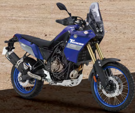
Icon Blue 藍深灰 176BQ2