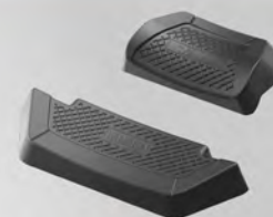
鋁後箱靠墊 | 23P-FTCBR-00