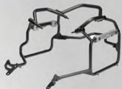
鋁側箱支架 | BW3-F84G0-00