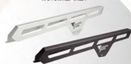
(另有銀色可選) 黑色鏈條護蓋 (黑色)BW3-F2310-00-01 (銀色)BW3-F2310-00