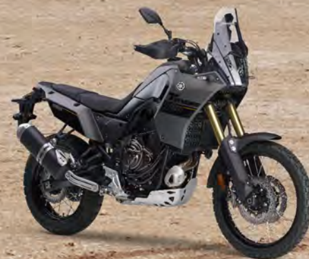
Tech Kamo 迷霧灰 176452