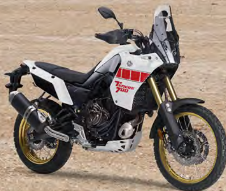
Heritage White 拉力白 176122