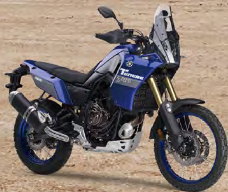
Icon Blue 標誌藍 176BQ3