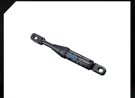
■ 車身減震拉桿套 B34-211H0-00