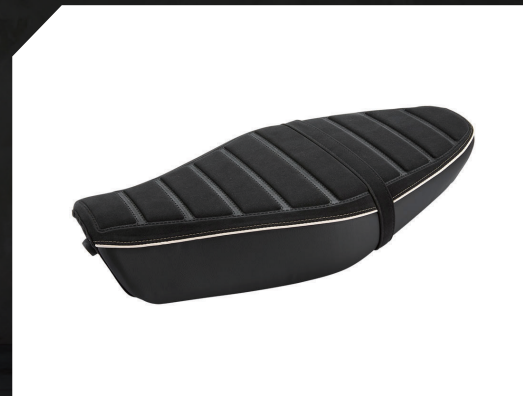
■ 雙人造型坐墊 B34-F4730-M2