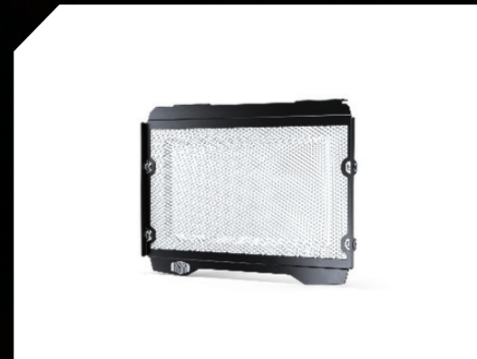
■ 水箱護網 BEF-E24D0-00

■ 商品以實物為主，本目錄僅供參考，詳情請洽經銷商。商品樣式，YAMAHA保留變更之權利。*若歐洲缺貨，則另行通知協商訂單處理。 ■ 部分選購配件為接單後向國外訂購進口引進，故會有等待時間。■ *若歐洲有在庫，系統下單後約45-60天到貨，以實際通知日期為準。 本圖僅供參考，實際ACC部品請參考台灣販售品項或YAMAHA官網。