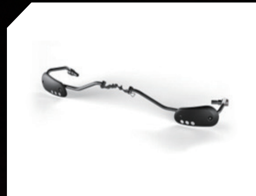
■ 把手護蓋 BEE-F85F0-00