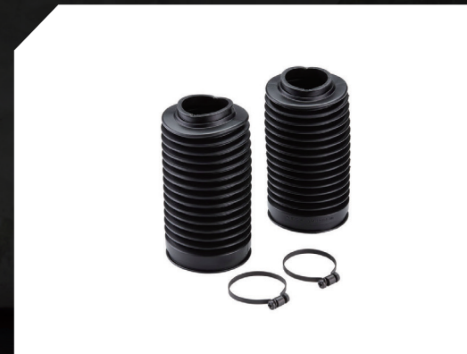
■ 前叉防塵套 B34-F31K0-00