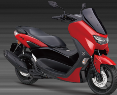
紅黑 E07083 (亮光)