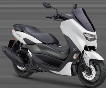
白灰 E07813 (亮光)