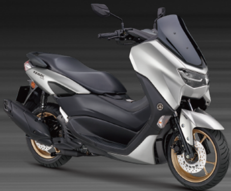
銀深灰 E07A13 (亮光)