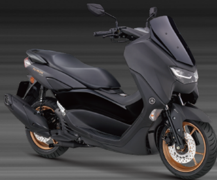
深灰黑 E07AE3 (消光)