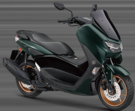
深綠黑 E07953 (消光)