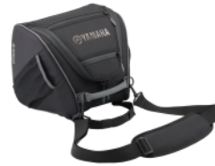
防潑水鞍座置物包 B6H-QF750-10