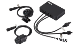
雙鏡頭行車紀錄器 BCC-QHDVVR-30