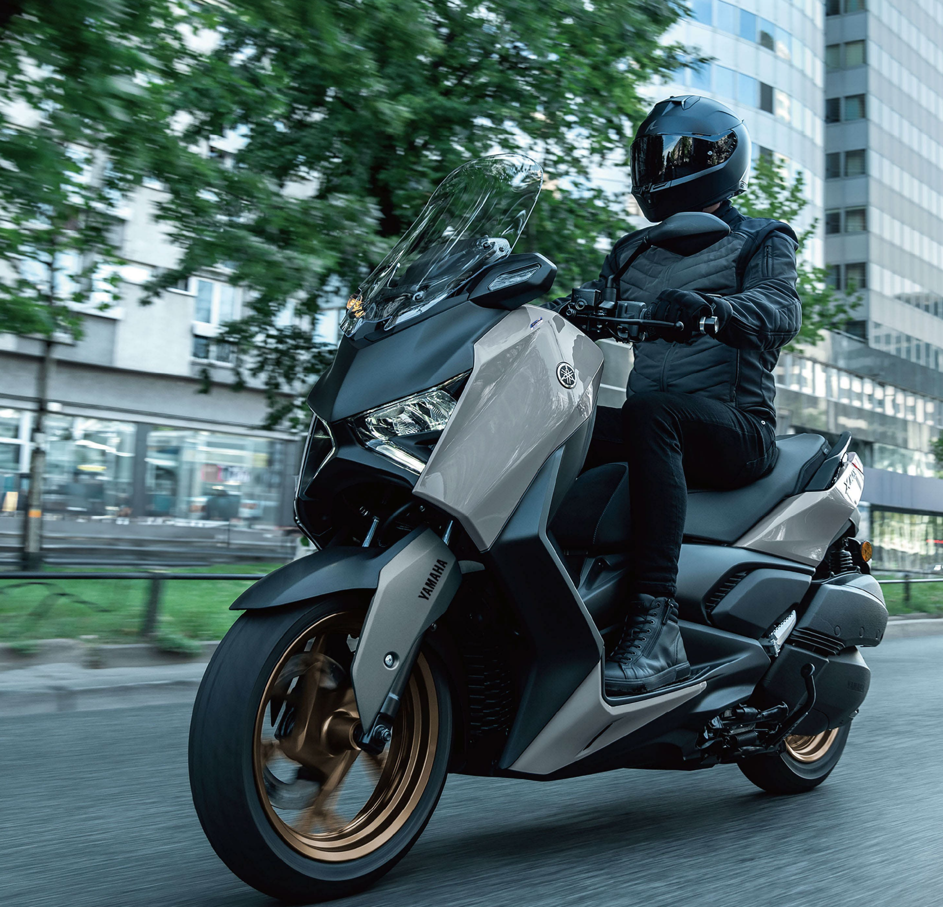
圖片為 YAMAHA 全球廣告影像。實際販售車輛之車色、樣式、配備均符合台灣法規，以實車為主。本影像經數位合成。