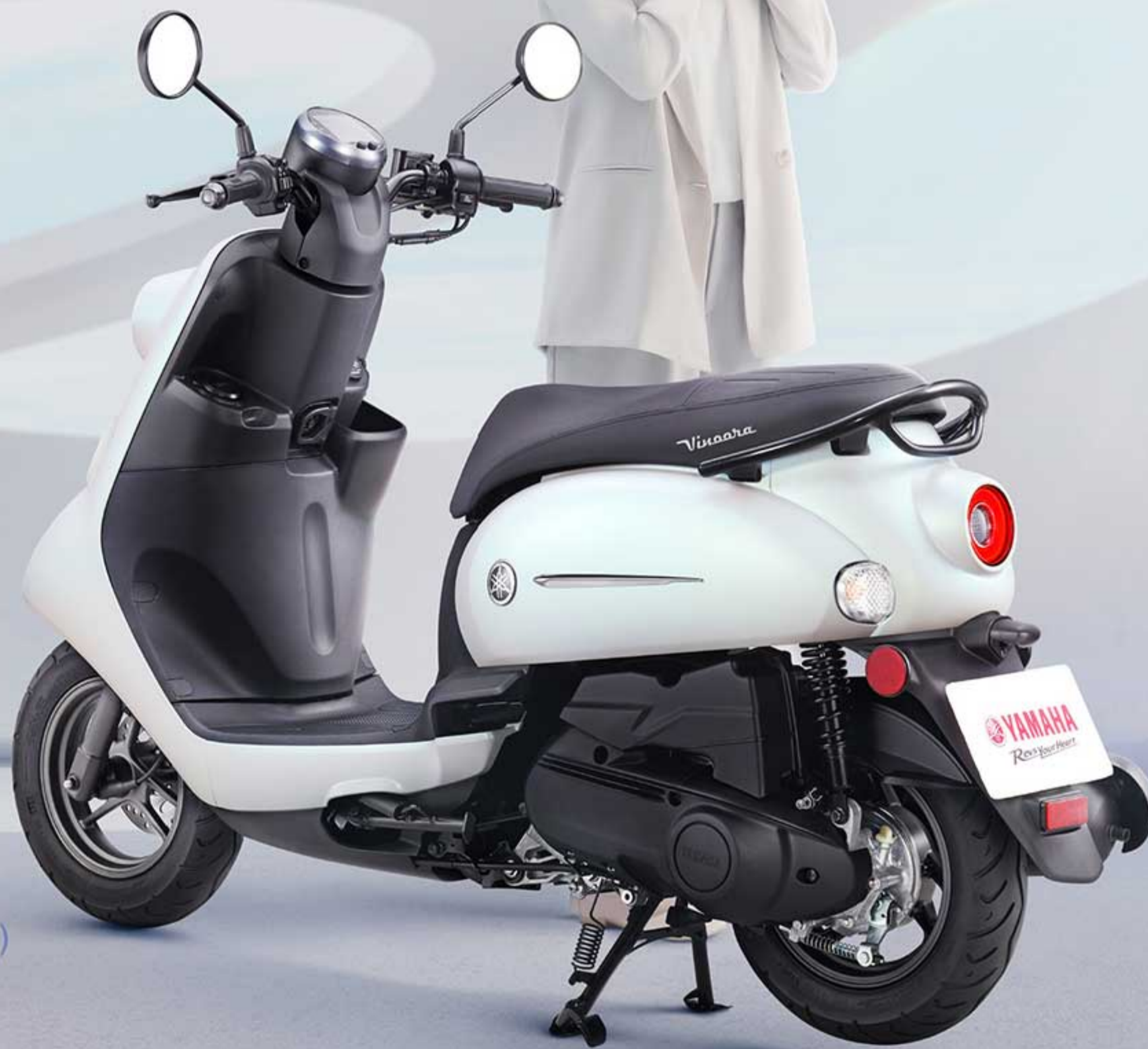
幻白 白(消光) D81052